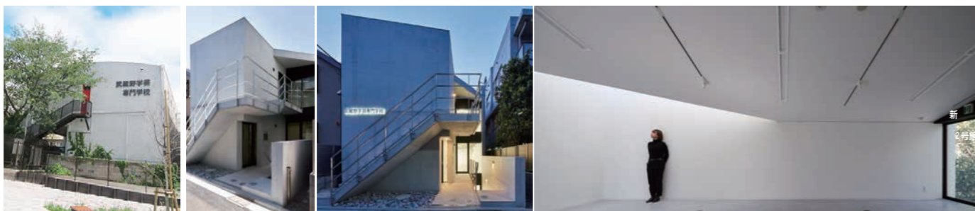
▲武蔵野学芸専門学校本館 ▲武蔵野学芸専門学校新2号館竣工 光の通る開放的なアトリエができました。ぜひ実際に見に来てください。

6月1日 >>>>> AOエントリー開始 エントリー締切日は毎週金曜日 (金曜日が祝日の場合は前日までです。)