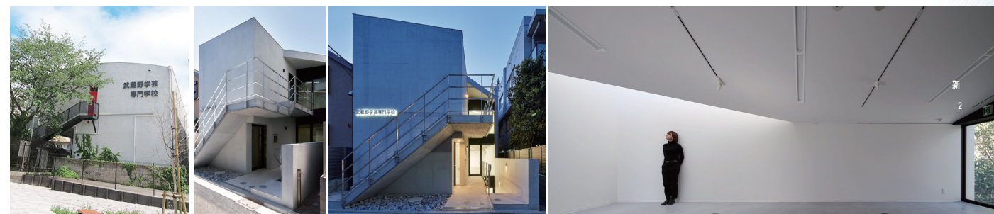
▲武蔵野学芸専門学校本館 ▲武蔵野学芸専門学校新2号館竣工 光の通る開放的なアトリエができました。ぜひ実際に見に来てください。

右下の「申し込みフォーム用QRコード」の申し込み、または面談希望の方は、希望日、時間、ご連絡先とお名前を添えて、お電話またはメールにてお申し込みください。(形式自由)